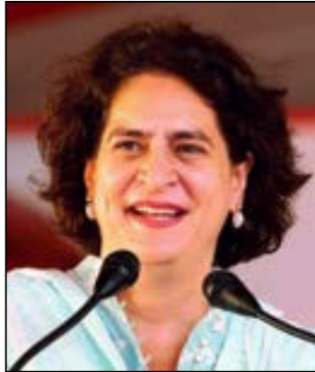
ശ്രീമതി. പ്രിയങ്ക ഗാന്ധി (ബഹു. വയനാട് നിയോജക മണ്ഡലം എം.പി)