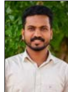
ജുനൈസ് പി.യു ഓവർസിയർ