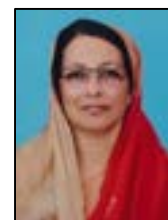
സാവിന ആർ.സി മെമ്പർ, വാർഡ് 11