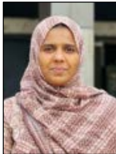
ഷബ്ന ജി സീനിയർ ക്ലർക്ക്