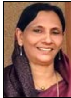
ഉമ്മുകുൽസു കെ പി.റ്റി.പി.കെ