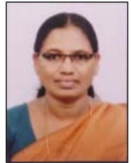
തങ്കം കെ പി.റ്റി.പി.കെ