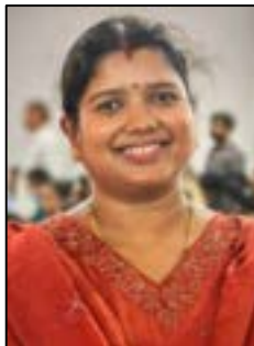
റിനീജ പി എ.ഐ.ടി.എ