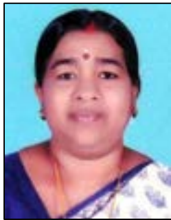
ശ്രീമതി സി.എം പി.റ്റി.എസ്