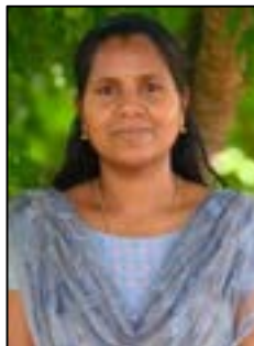
രേഖ ജെ എ.ഐ.ടി.എ