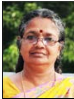
പ്രേമാവതി എസ് പി.റ്റി.എൽ