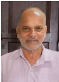
സി മത്തീ 2-ാം വാർഡ്