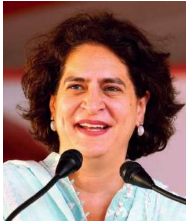
ശ്രീമതി. പ്രിയങ്ക ഗാന്ധി (ബഹു. വയനാട് നിയോജക മണ്ഡലം.പി)