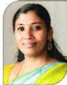
പി കെ സിന്ധു വാർഡ്-17, കുണ്ടുലാട്