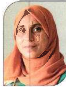
സഫുറ കെ വാർഡ്-3, ചാലിൻവയൽ