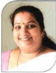
പ്രിയ ടി സി വാർഡ്-1, കണ്ണാടിപ്പാറ