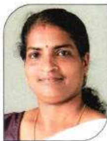
മിനി കെ വി വാർഡ്-10, കോട്ടപ്പാറ