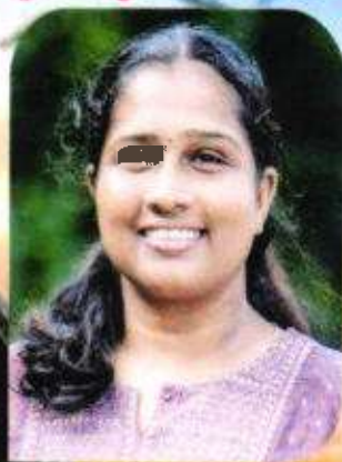
വിജി വി.പി പ്രസിഡന്റ് ചെങ്ങളായി ഗ്രാമപഞ്ചായത്ത്