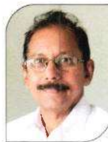
രാജ്കുമാർ ടി വാർഡ്-12, കൊയ്യം