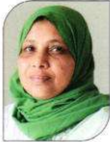
ഹസീന സി കെ വാർഡ്-14, തെർളായി