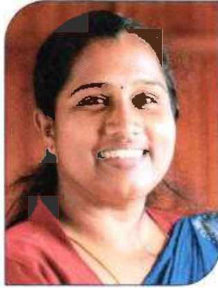
വിവിന ബി പി പ്രസിഡണ്ട്