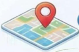
Social Media Cell Wayanad

3 ഭാഷയും ഒടിപി (OTP) പരിശോധനയും ഇഷ്ടപ്പെട്ട ഭാഷ തിരഞ്ഞെടുക്കുക, കൂടാതെ രജിസ്റ്റർ ചെയ്ത മൊബൈൽ നമ്പറിൽ അയച്ച ഒടിപി നൽകുക.