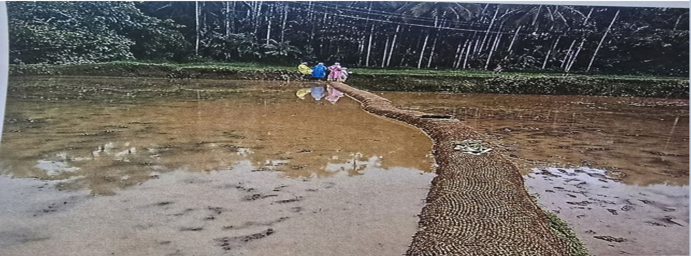
ജലസേചന കനാൽ നിർമ്മാണത്തിനായി എസ്റ്റിമേറ്റ് തയ്യാറാക്കിയതിനു ശേഷം അത് മറി കടന്നു കൊണ്ട്

മൂന്നാം വാർഡിലെ പാടശേഖരത്തിൽ നാലു റീച്ചുകളിലായി ജലസേചന കനാൽ നിർമ്മിച്ച് കയർ ഭൂവസ്ത്രം വിരിച്ച് അതിൽ പ്രാദേശികമായി ലഭിക്കുന്ന പുല്ലുകൾ വച്ചു പിടിപ്പിക്കുന്നതിനാണ് എസ്റ്റിമേറ്റ് തയ്യാറാക്കിയിട്ടുള്ളത്. (TS No.1601002004/2024-25-13525/TS). ഇതിനായി രണ്ടിനങ്ങളിലായി 0.75 മീറ്റർ ആഴത്തിൽ മണ്ണ് കോരിയും കുഴിച്ചും കനാൽ നിർമ്മിക്കുന്നതിനും കയർ ഭൂവസ്ത്രം വിരിക്കുന്നതിനുമുള്ള ഇനങ്ങളാണ് എസ്റ്റിമേറ്റിൽ ഉൾപ്പെടുത്തിയിരുന്നത്. എന്നാൽ, ഈ പ്രവൃത്തിയുടെ അളവു പുസ്തകത്തിൽ (നം.157/24-25) രേഖപ്പെടുത്തിയിരുന്നപ്രകാരം കനാൽ നിർമ്മിക്കുന്നതിനുള്ള മൺപണി നടത്തിയിട്ടില്ല എന്നു കാണുന്നു. കയർ ഭൂവസ്ത്രം വിരിക്കുന്ന പ്രവൃത്തി മാത്രമേ നടത്തിയിട്ടുള്ളൂ. പ്രവൃത്തി ഫയലിൽ ഉൾക്കൊള്ളിച്ചിട്ടുള്ള ഫോട്ടോ പ്രകാരം പാടങ്ങൾക്കിടയിലെ വരമ്പിൽ കയർ ഭൂവസ്ത്രം സ്ഥാപിച്ചതായി കാണുന്നു. ഫോട്ടോ ചുവടെ ചേർക്കുന്നു.