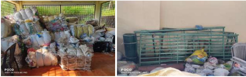
( എം സി എഫ് )