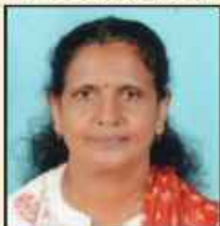
ഐസി ഐസക് XI -ാം വാർഡ് മെമ്പർ