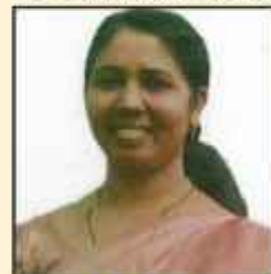
ബിജി എ. XVI -ാം വാർഡ് മെമ്പർ