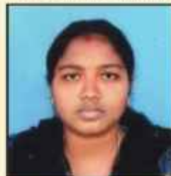
ഭവ്യ പി. എസ്. VII -ാം വാർഡ് മെമ്പർ