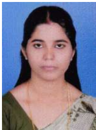
ലത കെ ടി