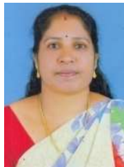
വിന കെ ബി